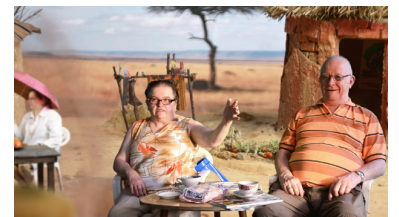
ULU BRAUN DEU / 19 min

Burkina Brandenburg Komplex describes the geographical construct created by 'our' media-driven collective image of Africa and puts its inaccuracies to the test.