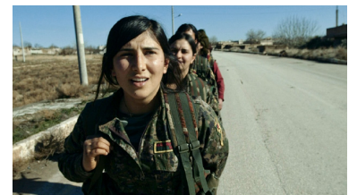
REBER DOSKY NLD / 16 min

Filmed during the battle of Kobani, this film reveals the women at the heart of the fight against IS.