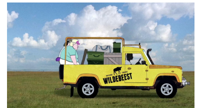
NICOLAS KEPPENS, MATTHIAS PHILIPS BEL / 19 min

Going on a safari is a dream for many. For middle-aged couple Linda and Troyer, it turns into a horribly real adventure when they get left behind in the wilderness.